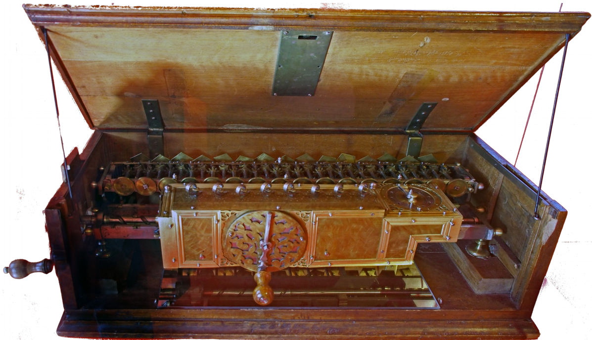
Original de la machine à calculer de Leibniz